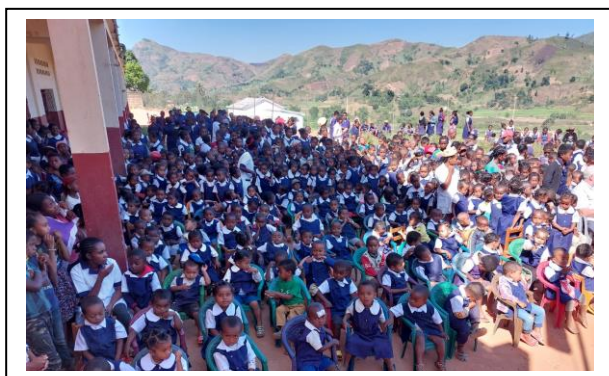
Jour de fête à l'école