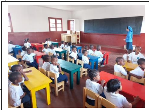
Le nouveau bâtiment terminé