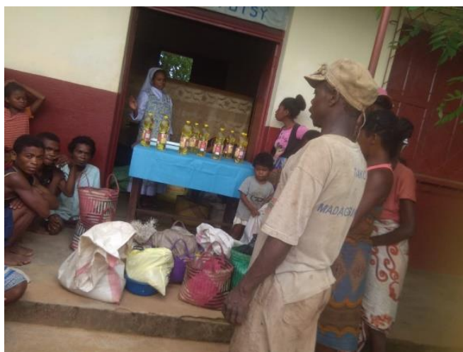
Distribution d'aide alimentaire après le cyclone.

*Concernant la réception des travaux effectués, les réserves ont été levées, la retenue de garantie peut être versée. Le cabinet dentaire a été réceptionné, à l'exception d'une prise électrique non conforme. Désormais il faut trouver un dentiste puisque celui prévu est parti !