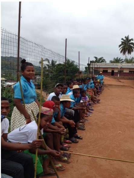
Vu du grillage derrière les élèves

Un nouveau grillage sur le terrain de Basket vient d'être posé pour assurer la sécurité des élèves.